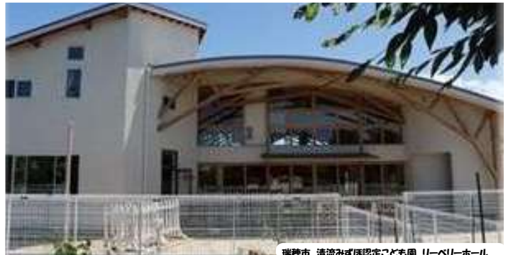
瑞穂市 清流みずほ認定こども園 リーベリーホール