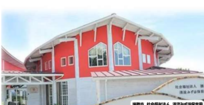
瑞穂市 社会福祉法人 清流みずほ保育園