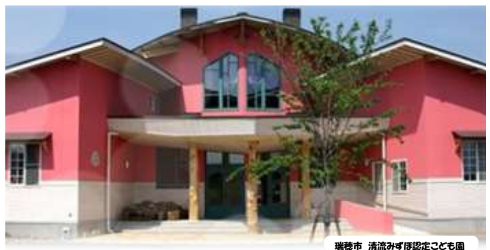
瑞穂市 清流みずほ認定こども園