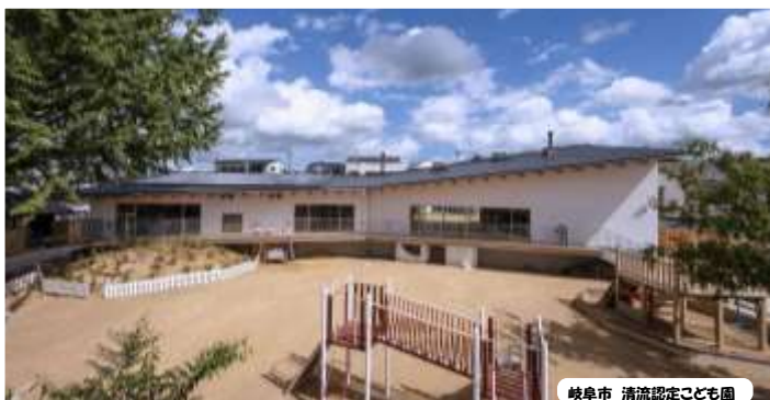
岐阜市 清流認定こども園